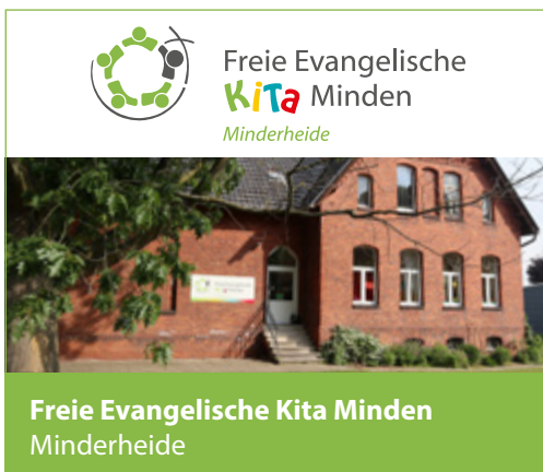
Freie Evangelische Kita Minden Minderheide

Unterschrift des Vaters bzw. des Erziehungsberechtigten