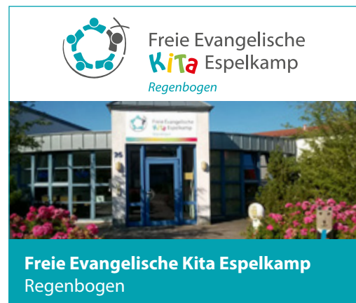
Freie Evangelische Kita Espelkamp Regenbogen